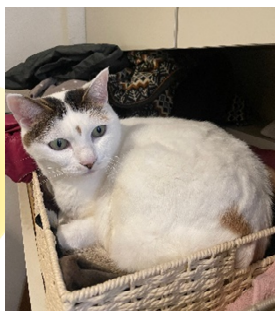
ミイはとにかく良く寝る