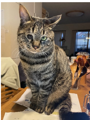
フウはテーブルの上ですぐ上がります