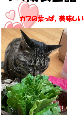
カズの葉っぱ、美味しい