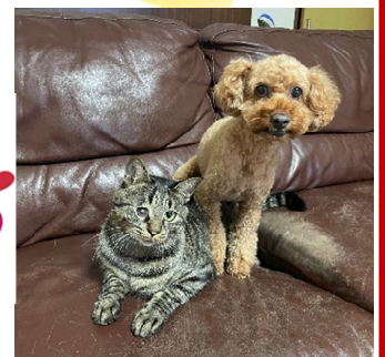
良いお年を ♪ ♪